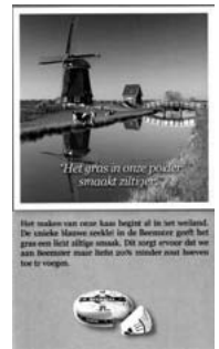
Kaas uit de Beemster (reclamefolder)