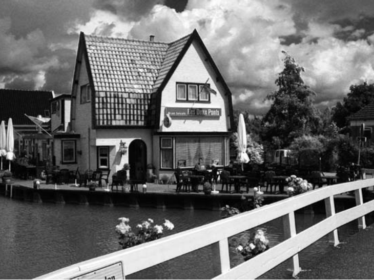
Startpunt voor de fietstocht was café Les Deux Ponts in Oudendijk, gelegen aan de Westfriese Omringdijk.

De verkenning van de Beemster vond plaats per fiets. Het was een opsteker als bij 'windkracht zoveel' zoon Harald de koppositie innam. Als startplaats kozen we – in het voetspoor van de ANWB-fietstocht – Oudendijk, gelegen aan de aloude en vermaarde Friese Omringdijk. Voor de aftrap genoten we vanuit het schitterend gelegen café Les Deux Ponts van het prachtige uitzicht over de Beemsterringvaart en de wetering. De laatste was gegraven voor de afvoer van overtollig boezemwater .