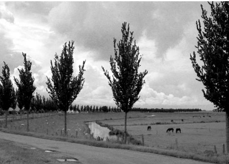
Fietsend over de Noorddijk van de Beemster.

De naam Beemster is waarschijnlijk afgeleid van Bamestra, een riviertje in het voormalige veengebied. Ontginning van het veen door de mens in combinatie met stormvloeden leidde ertoe dat dit riviertje ergens in de periode 1150 - 1250 uitgroeide tot een binnensee, een meer dat in open verbinding stond met de Zuiderzee. Joost van den Vondel (1587 - 1679) roemde in de Gouden Eeuw reeds de schoonheid van de drooggemalen Beemster in een gedicht dat hij maakte in opdracht van Karel Looten, wiens familie er een buitenplaats bezat.