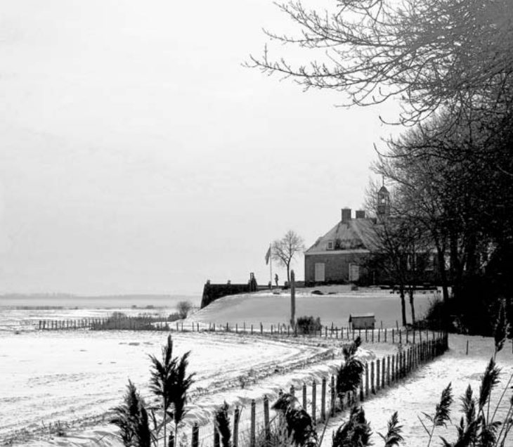
Winter op Schokland. Boven: Middelbuurt.