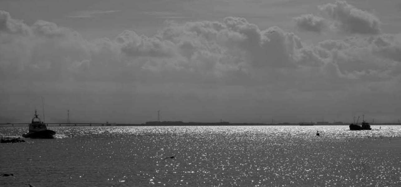
Foto boven: zicht op de Ketelbrug. Foto vorige pagina de Oostvaardersdijk.

Oorspronkelijk verschenen in Millennium (Amsterdam: De Arbeiderspers, 1946), later opgenomen in C. Buddingh' (red.), Balladen en Refereinen (Utrecht/Antwerpen: Het Spectrum, z.j.)