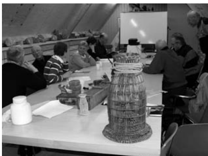
Cursus op de Stenezolder van Museum Schokland.

De door de Vrienden van Schokland georganiseerde cursussen lopen goed,